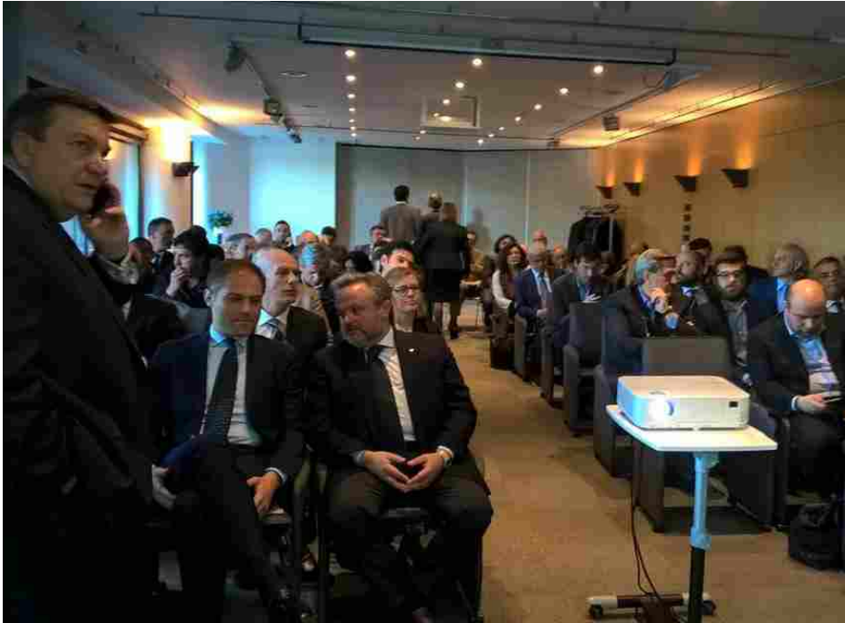
Opportunità di credito alle imprese operanti nel settore agroalimentare

Deangelis Cassiopea | 16 Mag, 2016, 21:37