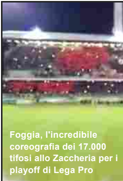
Foggia, l'incredibile coreografia dei 17.000 tifosi allo Zaccheria per i playoff di Lega Pro