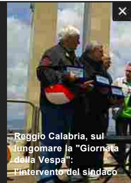
Reggio Calabria, sul lungomare la "Giornata della Vespa": l'intervento del sindaco