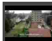
La Vaca Mora a Schio per l'Africa