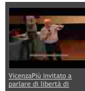
VicenzaPiu invitato a parlare di libertà di

Se sei registrato effettua l'accesso prima di scrivere il tuo commento. Se non sei ancora registrato puoi farlo subito qui , è gratis.