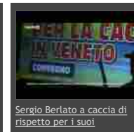
Sergio Berlato a caccia di rispetto per i suoi